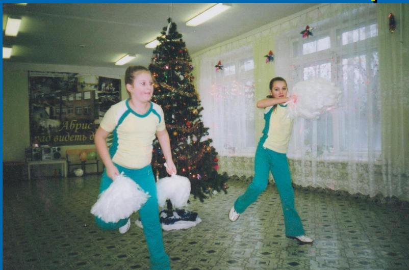
Выступление на Новогодней ёлке