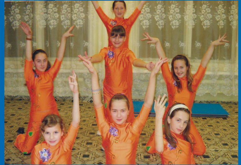
Подготовка к соревнованиям