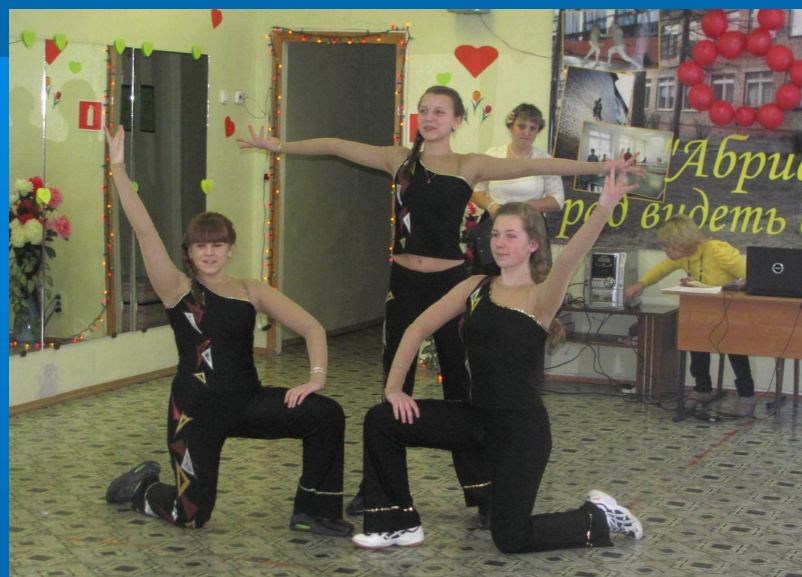
Выступление на празднике 8 Марта