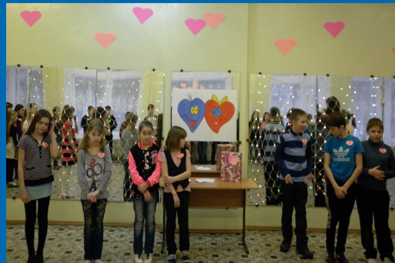
Участие в празднике День Святого Валентина