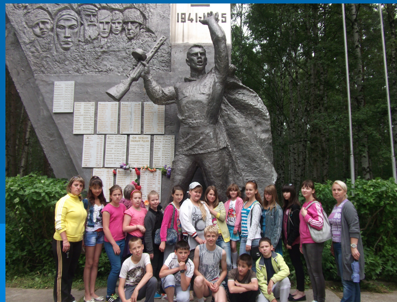
Экскурсия к Памятнику воину-освободителю (п. Резинотехника)