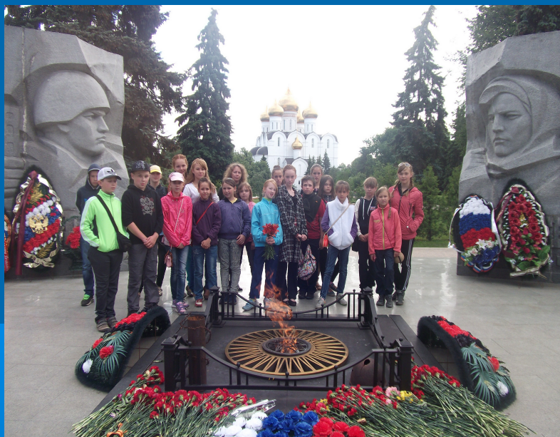
Экскурсия к Вечному огню