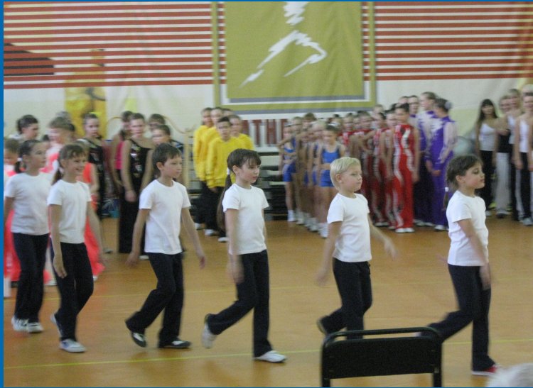
Кубок г. Ярославля по фитнес-аэробике